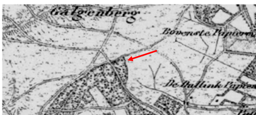
Bosaanleg binnen de wal op Topografische Militaire Kaart 1850-1864