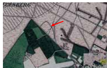
Wal op Topografische Militaire Kaart 1872