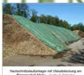
Hackschnitzstoffentlager mit Vliesabdeckung am Biomassenhof Adgäu