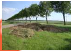
Houtchips afkomstig van snoeiwerk