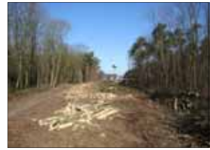
Aanleg nieuwe verbindingsweg