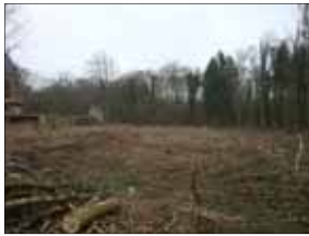
Eindkap, daarna herplant