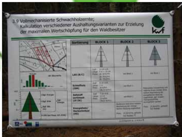
KWF-tagung Schmallenberg 2009