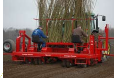
De vierrijige Egedal Energy Planter.

Op puur economische gronden is de aanleg van wilgenenergieplantages met de huidige biomasprijzen op 'dure' landbouwgronden